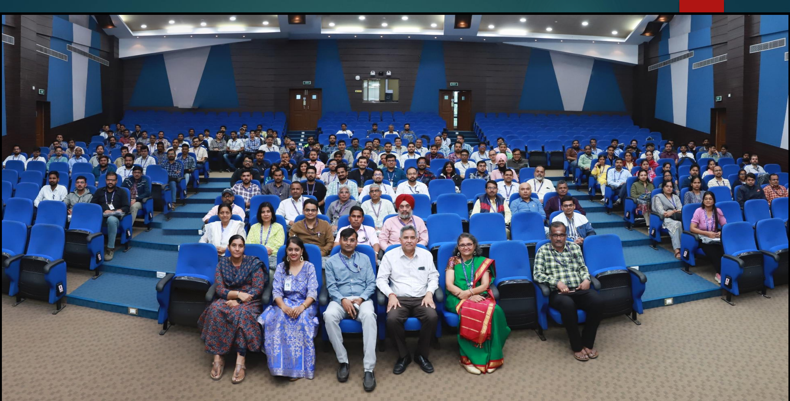
कार्यशाला में उपस्थित प्रतिभागियों का समूह चित्र